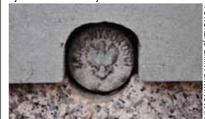
Na zdjęciu: znak w murze kościoła w Brwinowie (od strony wschodniej)

Prowadzone obecnie prace są wykonywane na zlecenie Starosty Pruszkowskiego przez przedsiębiorstwo geodezyjno-kartograficzne OPGK Rzeszów S.A. Będą one obejmować przegląd i inwentaryzację osnowy wysokościowej. Jednocześnie z inwentaryzacją osnowy prowadzony jest wywiad terenowy, dzięki któremu będzie można ustalić miejsca stabilizacji nowych punktów osnowy oraz określić stosowny typ stabilizacji. Dla każdego nowego punktu wykonawca musi uzyskać na piśmie wstępną zgodę właściciela nieruchomości na umieszczenie znaku geodezyjnego. Nowo projektowane punkty muszą znajdować się w dostępnych miejscach. W pierwszej kolejności będą osadzone na budynkach posiadających fundamenty.