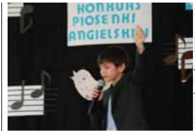
FOT. ZESPÓŁ SZKÓŁ W OTRĘBUSACH