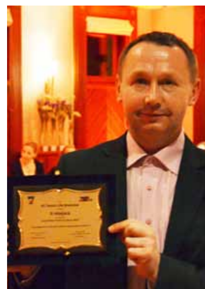
FOT. KS TENNIS LIFE (2)

Drugie miejsce w konkursie Klub Roku Tenis10 2015 to ogromny sukces i powtórzenie wyniku sprzed trzech lat. Klub Sportowy „Tennis Life” potwierdził w ten sposób, że należy do elity polskich klubów tenisowych, których głównym