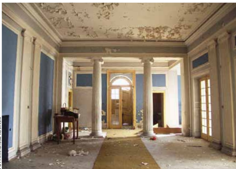
Na zdjęciu: wnętrze pałacu, widok na drzwi wejściowe. Zdjęcie z 2010 r.