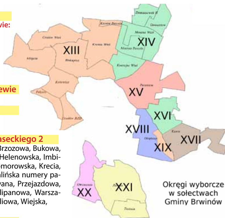
Okręgi wyborcze w sołectwach Gminy Brwinów

Komisja obwodowa nr 16: miejscowości Terenia, Żółwin