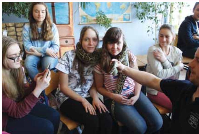
FOT. ZS NR 1 W BRWINOWIE (3)

Podsumowaniem wizyt niezwykle gości było przedstawienie pt.: „Dwie Dorotki”, które zostało przygotowane dla klas młodszych przez szkolnych wolontariuszy. Teatrzyk niezwykle, bo z udziałem psów z Klubu DOGLINE. Aktorzy musieli poradzić sobie nie tylko z nauczeniem się tekstu, zapamiętaniem kolejności i sposobu poruszania się po scenie, lecz także nauczyć współpracy z psami