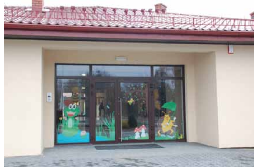
Na zdjęciach: Drzwi wejściowe do nowego budynku przedszkola w Brwinowie.

z przepisami wchodzącymi w życie w tym roku, każdy 4-latek ma prawo otrzymać miejsce w przedszkolu. Brakujące miejsca należy wykupić w przedszkolach prywatnych. Sytuacja skomplikowała się jednak jeszcze bardziej: rodzice 5-latków także chcieliby, aby ich dzieci jeszcze przez rok mogły pozostać w przedszkolu. Podania w tej sprawie złożyła liczna grupa rodziców. Zgodnie z przyjętym przez Radę Miejską w Brwinowie w 2011 r. systemem organizacji pracy placówek oświatowych dla potrzeb realizacji rocznego obowiązkowego wychowania przedszkolnego burmistrz zdecydował o zapewnieniu wszystkim 5-latkom miejsc w oddziałach przedszkolnych w szkołach podstawowych. Zważywszy, że obecnie do „zerówek” szkolnych uczęszcza 293 dzieci (145 5-latków oraz 148 6-latków) a od 1 września 2015 r. wszystkie 6-latki trafią do klas pierwszych,