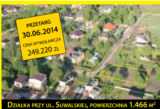
DZIAŁKA PRZY UL. SUWALSKIEJ, POWIERZCHNIA 1.466 m 2

Warunkiem przystąpienia do przetargu jest wpłacenie wadium w wysokości 10% ceny wywoławczej w terminie do 25.06.2014 r.