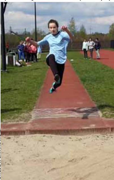
FOT. ZSO W BRWINOWIE (2)