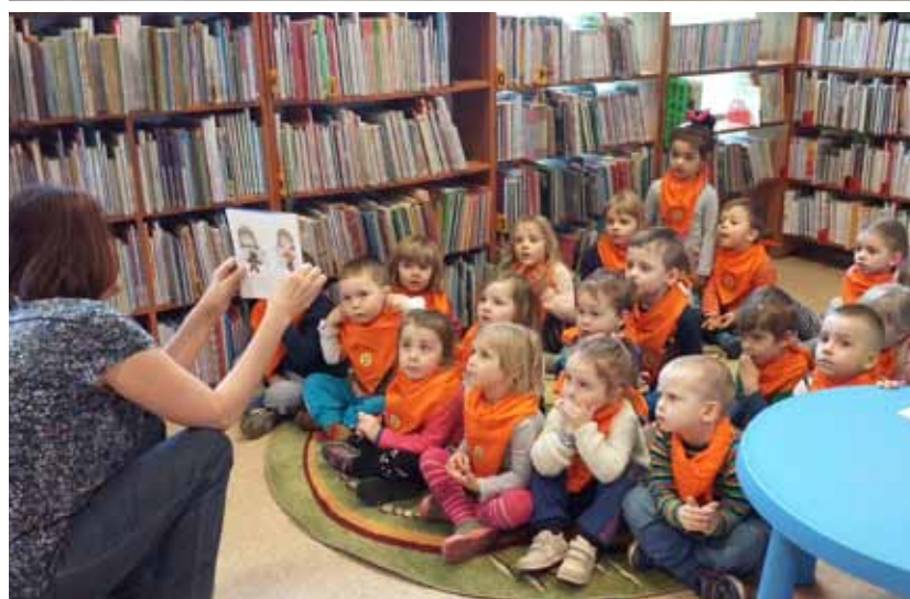
Powyżej: wizyta dzieci ze Słonecznego Przedszkola w Bibliotece Publicznej.

Bibliotek. W godzinach wieczornych zapraszamy w progi naszej filii w Otrębusach, ul. Wiejska 1. W pięknym, odremontowanym Pałacyku Toeplitzów, 4 czerwca (sobota) będziemy gościć Dariusza Koźlenkę, autora książki pt. „Sami swoi. Za kulisami komedii wszech czasów” (książka do wypożyczenia w Bibliotece) oraz Grażynę Szymańską brwinowską poetkę. Tegoroczna, II edycja Nocy Bibliotek odbywa się pod hasłem „Wolno czytać”. W naszej Bibliotece, z uwagi na Rok Waława Kowalskiego – mieszkańca Brwinowa i znakomitego aktora – mottem spotkania będzie: „wśród samych swoich”. Początek Nocy godz. 17 00 , koniec... Podczas Nocy będziemy wspominać codzienne życie Waława Kowalskiego. Postać aktora przybliży nam Pan Andrzej Mączkowski, nasz mieszkaniec, pasjonat i poszukiwacz naszej historii. Zapraszamy również wszystkie osoby, które spotkały się z Waławem Kowalskim, aby opowiedziały nam ciekawe anegdoty związane z tą postacią. Do obejrzenia będzie również wystawa rysunków młodzieży z „Galerii Pomysłów Pasja” – Pracowni edukacji artystycznej z Kań pt. „Sami swoi”. Podczas Nocy Bibliotek filia Biblioteki w Otrębusach będzie wykonywała wszystkie czynności związane ze swoimi podstawowymi zadaniami, będzie można oddać lub wypożyczyć książki (pozostałe placówki Biblioteka Główna i Oddział dla Dzieci w Brwinowie będą zamknięte).