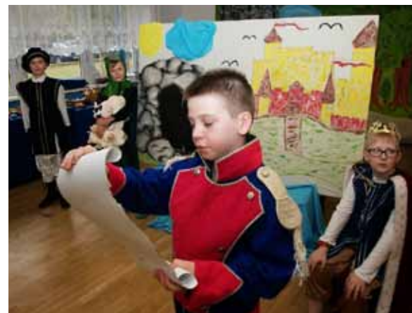
FOT. ZS W OTRĘBUSACH (3)