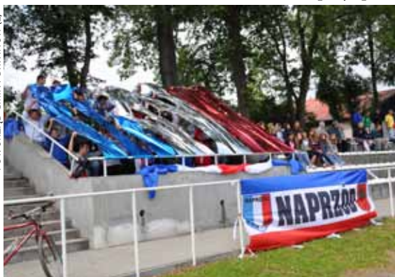
FOT. URZĄD GMINY BRWINÓW (2)

Na zdjęciach poniżej: Mecz kończący sezon rozgrywek 2013/2014.