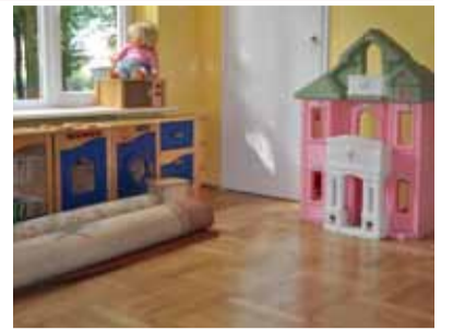
FOT. URZĄD GMINY BRWINÓW (2)

Realizacja projektu umożliwi dostęp do nowych technologii osobom z różnym stopniem niepełnosprawności, samotnym rodzicom, rodzinom zastępczym i objętym systemem pomocy społecznej lub świadczeń rodzinnych. Więcej informacji na stronie: