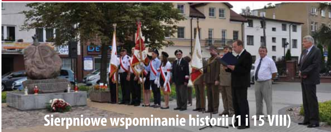
Sierpniowe wspomnianie historii (1 i 15 VIII)