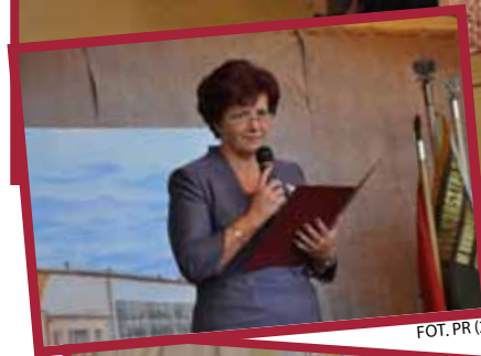
Fotografie powyżej i z lewej: uroczystości 15 października Fotografia poniżej: Wieczór wspomnień.