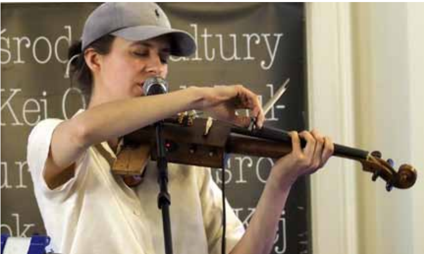
MALINA MALINA / koncert / 13 maja