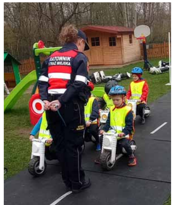
zdjęcia użyte w artykułach_ARCHIWUM BIBLIOTEKI