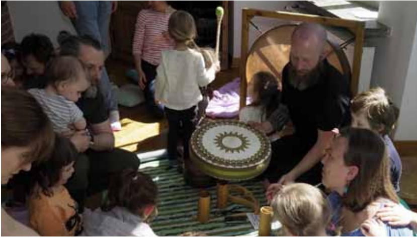
KĄPIEL W DŹWIĘKACH / 23 kwietnia