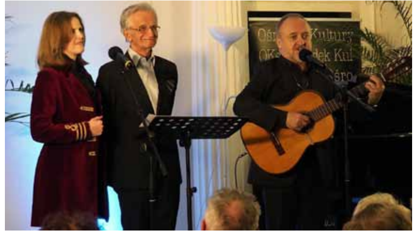
BRWINOWSKA SCENA KABARETU LITERACKIEGO / 23 kwietnia