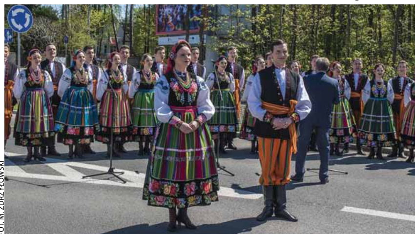
Na zdjęciach poniżej: Przy nowym rondzie wystąpili artyści Zespołu „Mazowsze” oraz szkolny zespół instrumentalno-wokalny.