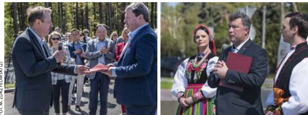
FOT. M. ZDRZYŁOWSKI (2)