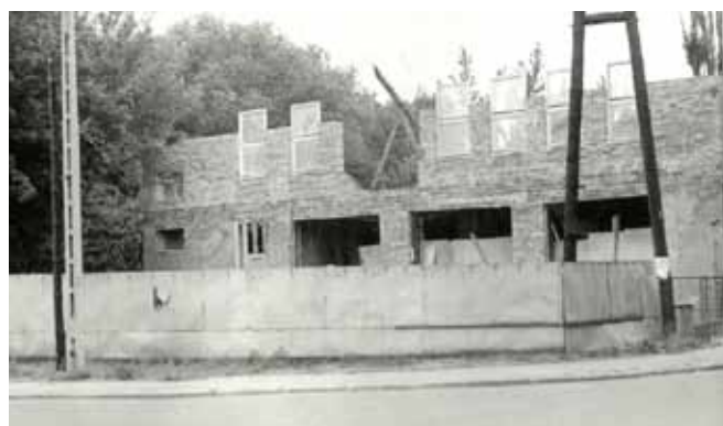
Na zdjęciu powyżej: rozbudowa strażnicy OSP przy ul. Pszczylińskiej. Budynek z lat 40. nie miał pomieszczeń na piętrze.