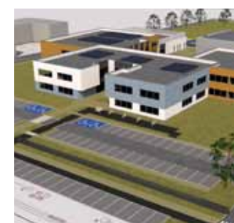
RYS. PRACOWNIA PROJEKTOWA EKOBUD

Dalsze informacje o losach tego przetargu – po ponownej analizie ofert.