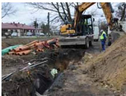
Na zdjęciach: Widok na ul. S. Lilpopa w Brwinowie, widok na ul. Szkolną w Żółwinie oraz początek prac na ul. Sienkiewicza w Brwinowie. U góry z prawej strony: układanie asfaltu na ścieżce rowerowej prowadzącej do szkoły w Żółwinie.