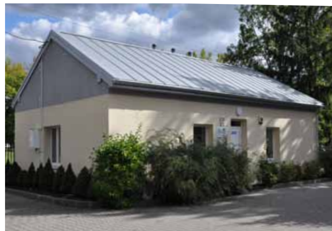
Na zdjęciu od góry: po remoncie elewacji starej części szkoły w Żółwinie trudno będzie odróżnić ją na pierwszy rzut oka od nowego skrzydła oddanego do użytku w ubiegłym roku. Poniżej: świetlica ŚOPS przy ul. marsz. J. Piłsudskiego.

Wymienione zostaną rynny i daszek nad schodami. Schody wejściowe zewnętrzne prowadzące do sali gimnastycznej zostaną odtworzone. Wykonawca zmodernizuje też dwa pomieszczenia w budynku szkoły. Koszt wszystkich prac wyniesie 214.425,08 zł. Ich zakończenie ma nastąpić do 30 listopada br.