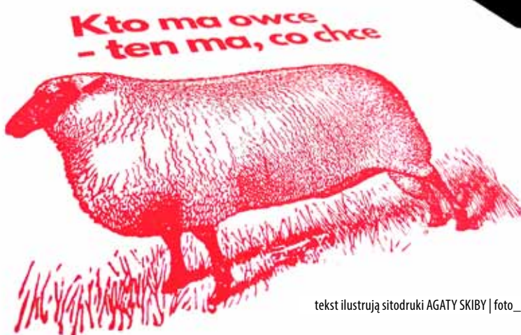
tekst ilustrują sitodruki AGATY SKIBY

W myśl jedynie słusznej formuły (nie tylko w Owczarni), przed nami i Wami moc perspektyw ;)