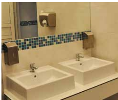
Na zdjęciach: ZSO – nowe łazienki i kompleks sportowy zmodernizowany z dotacją samorządu województwa.

Do końca listopada ma czas wykonawca remontu elewacji w Szkole Podstawowej w Żółwinie . Zadanie obejmuje naprawę fragmentów elewacji tynkowej i elewacji z cegły klinkierowej, czyszczenie i odgrzybianie.