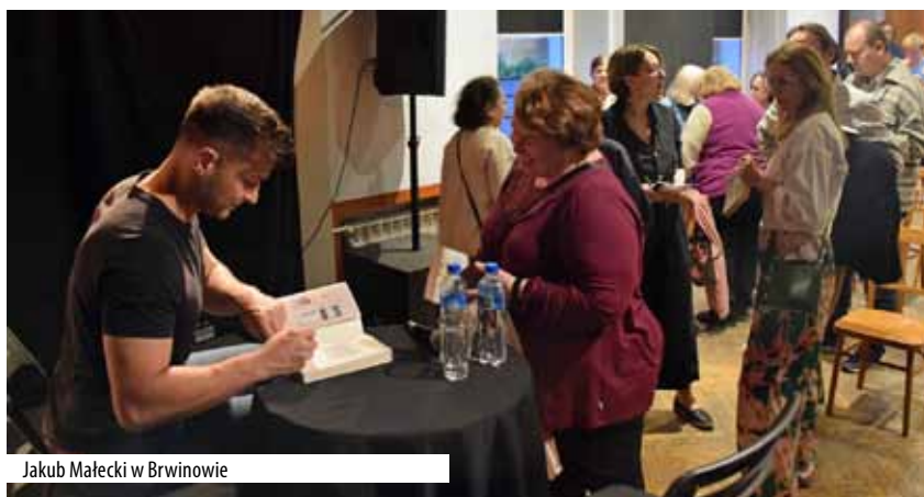
Jakub Małecki w Brwinowie