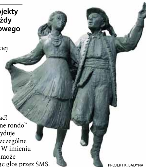
PROJEKT K. BADYNA

Czy w tym roku uda się znowu wygrać? Każdy głos się liczy! Projekt „Roztańczone rondo” znajduje się w puli podregionalnej. Zdecyduje liczba ważnych głosów oddanych na poszczególne projekty przez mieszkańców Mazowsza. W imieniu dziecka może zgłaszać rodzic. Każdy może zgłaszać tylko jeden raz, potwierdzając głos przez SMS.