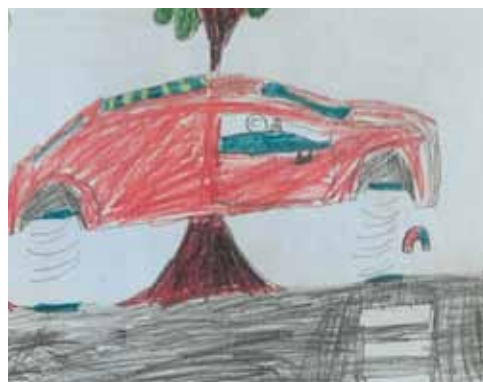
Rys. Nikodem Rybak z kl. Ib, SP w Żółwinie

Prace plastyczne miały być nawiązaniem do hasła przewodniego tegorocznego Europejskiego Tygodnia Zrównoważonego Transportu – „Korzystaj ze zrównoważonej mobilności. Dbaj o zdrowie”. Jedną z nagrodzonych prac pokazuje samochód z magnesami zamiast kół, druga – rowerzystę. Na wyróżnionych pracach widać przykłady z życia wzięte: hulajnogi, pociąg, rower i ścieżki rowerowe.