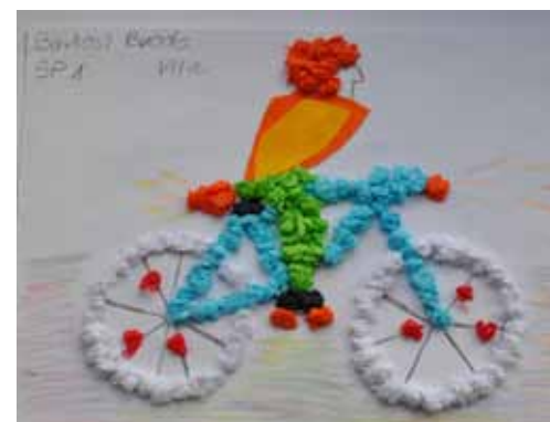
Rys. Bartosz Broda z kl. VIIa, SP nr 1