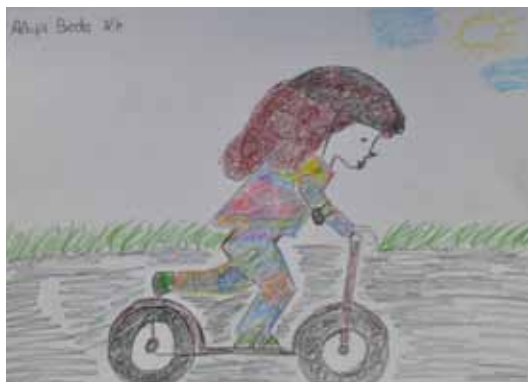
Rys. Alicja Broda z kl. IVb, SP nr 1