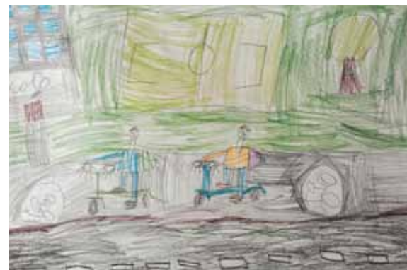
Rys. Jakub Gromadzki z kl. 2e, SP nr 2