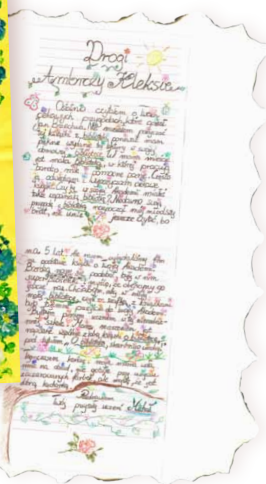
autor_Michał Zięba (10 l.)