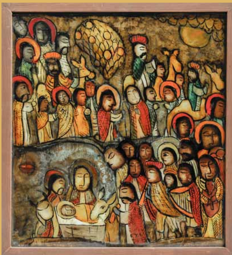
KRZYSZTOF OKOŃ, BOŻE NARODZENIE, OBRAZ NA SZKLE ZE ZBIORÓW MUZEUM SZTUKI LUDOWEJ W OTRĘBUSACH

RADOSNYCH I SPOKOJNYCH ŚWIĄT BOŻEGO NARODZENIA, ORAZ ZDROWIA I POMYŚLNOŚCI W REALIZACJI MARZEŃ, POSTANOWIEŃ I PLANÓW W NOWYM ROKU 2020 ŻYCZĄ MIESZKAŃCOM GMINY BRWINÓW ORAZ GOŚCIOM SPĘDZAJĄCYM TU ŚWIĘTA