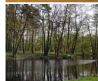
FOT. URZĄD GMINY BRWINÓW (PR)

ra i Środowisko 2014-2020 (działanie 2.5) w ramach II osi priorytetowej Ochrona środowiska, w tym adaptacja do zmian klimatu.