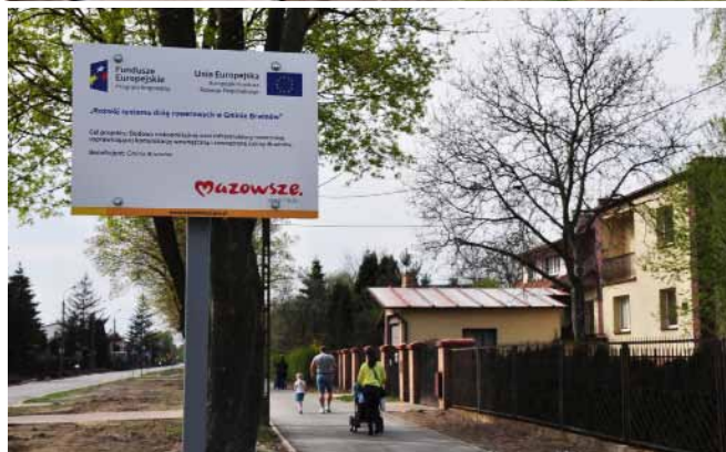
Na zdjęciach powyżej: powstaje ścieżka rowerowa z Brwinowa do Kotowic. Mieszkańcy już korzystają z ciągu pieszo-rowerowego wzdłuż ul. Sochaczewskiej.