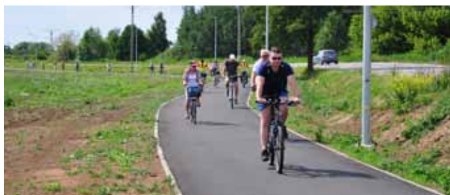
Na zdjęciu powyżej: asfaltowa ścieżka do Parzniewa, oddana do użytku w 2015 r., jest pod wieloma względami modelowym rozwiązaniem dla kolejnych inwestycji rowerowych.

Projekt „Rozwój systemu dróg rowerowych w Gminie Brwinów” otrzymał dofinansowanie w wysokości 4,8 mln zł ze środków UE – RPO Województwa Mazowieckiego 2014–2020.