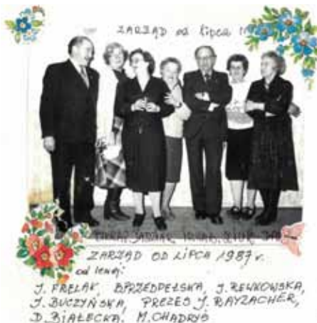
Na zdjęciu: Fragment kroniki Koła Związku Emerytów, Rencistów i Inwalidów w Brwinowie. Działający obecnie oddział rejonowy kontynuuje tradycje działania na rzecz seniorów.

Odbyły się też spotkania z okazji Świąt Wielkanocnych, Dnia Seniora i świąt Bożego Narodzenia, a także cztery wieczorki taneczne. Związek bierze udział w obchodach świąt państwowych organizowanych przez Urząd Gminy.