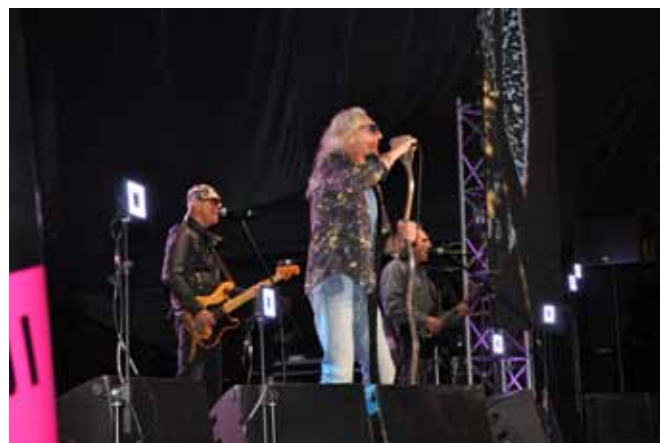
Na zdjęciach: migawki z Dni Brwinowa – występ zespołu Perfect oraz inscenizacja walk (atak samolotu Messerschmitt)