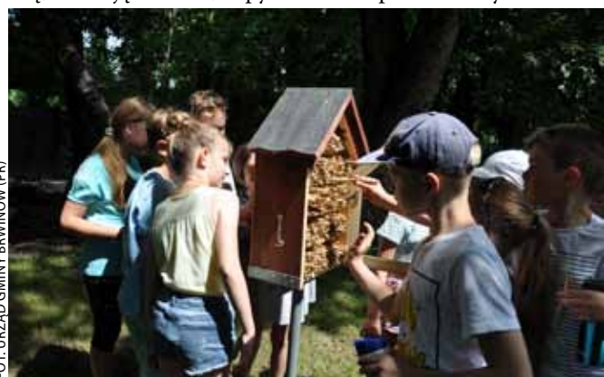
Na zdjęciu: Dzieci układają w hotelu dla murarek trzciniowe rurki, które wyciągnęły z niego dzięcioł odwiedzający Zagrodę.