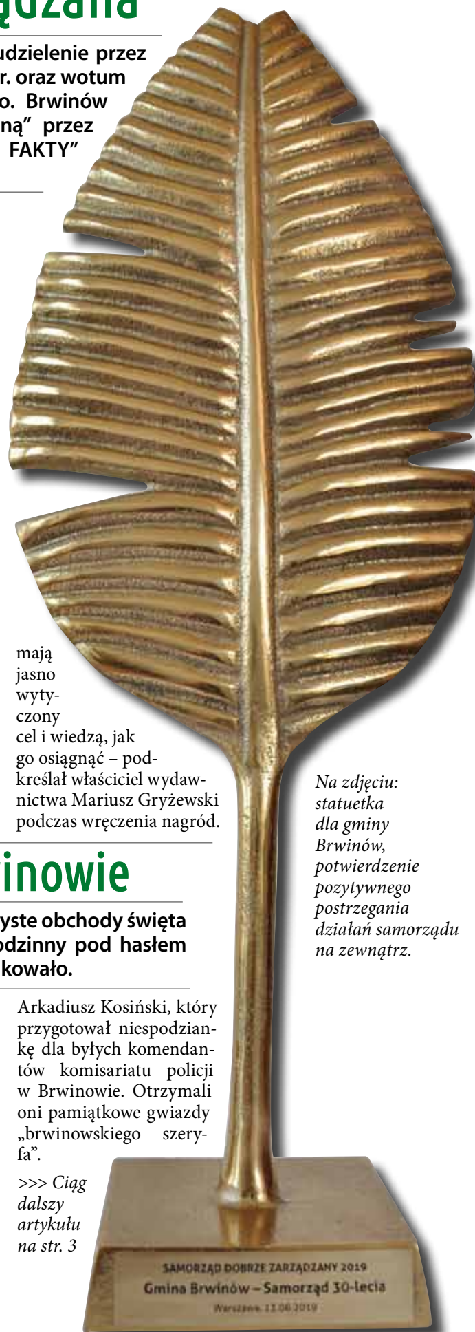
Na zdjęciu: statuetka dla gminy Brwinów, potwierdzenie pozytywnego postrzegania działań samorządu na zewnątrz.