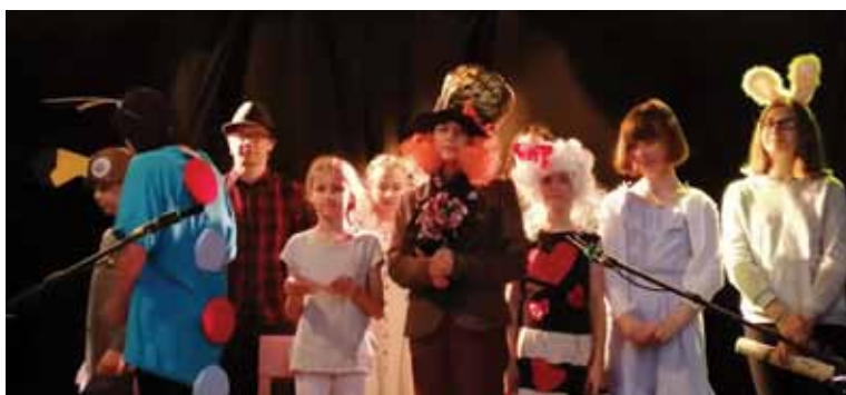
Czerwiec to czas podsumowań po całym roku wyężonej pracy :) Na zdjęciach adepci i dokonania pracowni: Plastycznej OK, KARTki, Warsztat Sztuki oraz ogniska muzycznego – grup wokalne i teatralnej