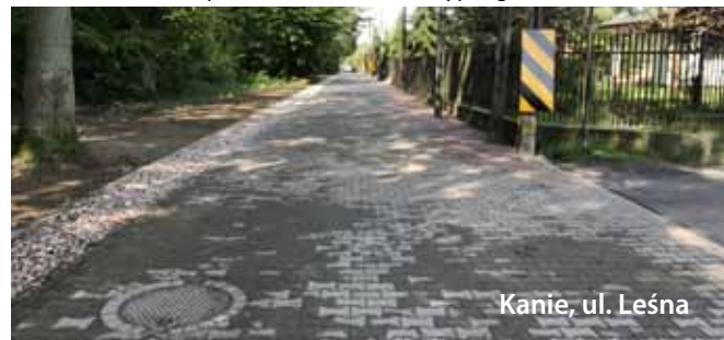
Kania, ul. Leśna

nienie zyskała ulica Leśna w Kaniach. Została przebudowana na odcinku od ul. Uroczej do ul. Górnej. Koszt tej inwestycji wyniósł 1.169.951,79 zł. Wykonawca zakończył prace w terminie. Poruszanie się w tym rejonie Kań jest teraz wygodniejsze i bezpieczniejsze. Przedłużenie drogi aż do ośrodka Patataj przez jakiś czas nie będzie możliwe, bowiem gmina musi wcześniej wybudować sieć wodociągową oraz kanalizacji, która połączy ul. Leśną z Osiedlem Słonecznym. Sprzeciwia się temu jeden z właścicieli sąsiednich nieruchomości, który po niepomyślnym dla siebie rozstrzygnięciu Samorządowego Kolegium Odwoławczego, zaskarżył tę decyzję najpierw do Wojewódzkiego, a następnie Naczelnego Sądu Administracyjnego.