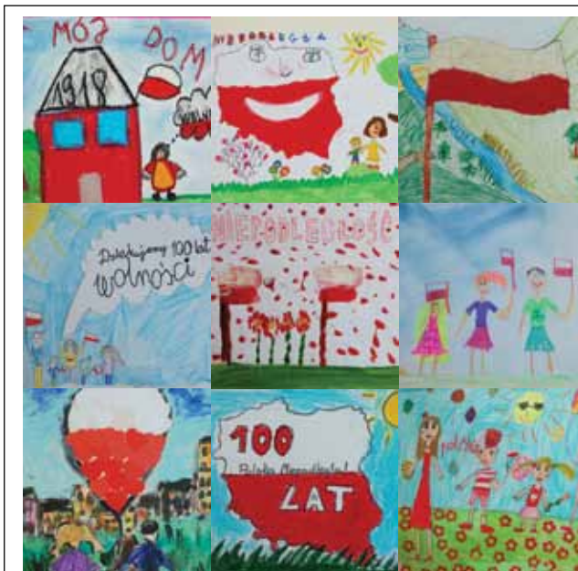
Wiersze i rysunki nadesłane na konkurs z okazji 100-lecia odzyskania niepodległości

W atmosferę konkursu wprowadził występ wokalny uczniów ze SP w Żółwinie i SP w Otrębusach. Uczniowie zaśpiewali żołnierskie pieśni patriotyczne. Występy wokalne towarzyszyły również później zmaganiom konkursowym: w czasie przerwy między pierwszą i drugą turą konkursu usłyszeć można było uczniów z SP nr 1 i SP nr 2 w Brwinowie. Na