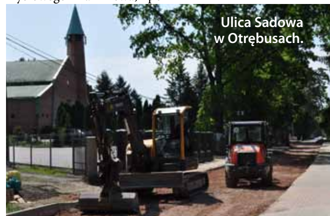
Ulica Sadowa w Otrębusach.