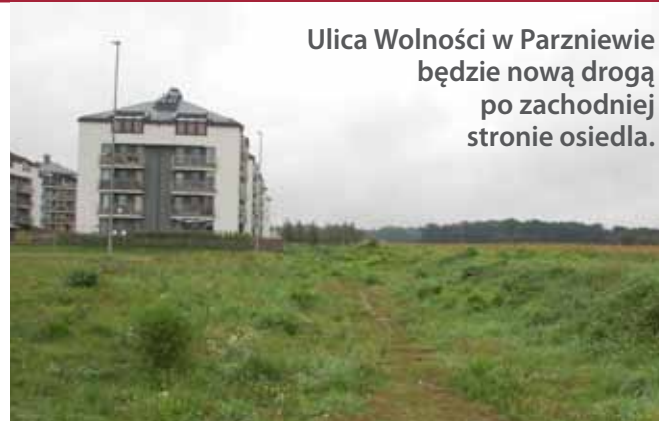
Ulica Wolności w Parzniewie będzie nową drogą po zachodniej stronie osiedla.

Została już podpisana umowa z wykonawcą i wkrótce rozpoczną się pra-