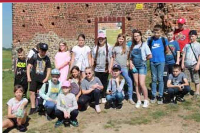
Na zdjęciach: nagrodami dla najlepszych klas były wycieczki do ciekawych miejsc i wiele wspólnych przeżyć.