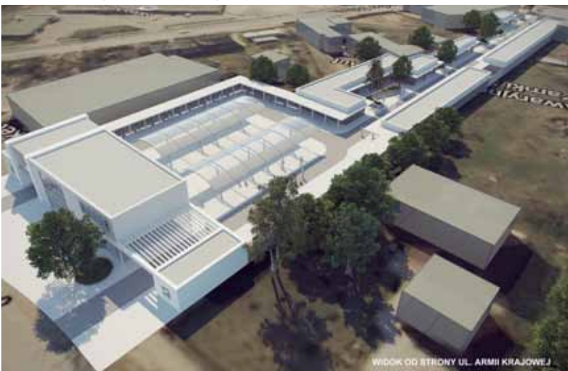
WIDOK OD STRONY UL. ARMII KRAJOWEJ

Rejestracja i informacje: www.brwinow.wdialogu.uw.edu.pl