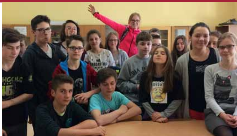
Na zdjęciach: uczniowie z Otrębus uczestniczący w projekcie oraz tradycyjne koniki drewniane z okolic Żywca i Suchej Beskidzkiej.

projektu jest promocja dziedzictwa niematerialnego własnego kraju i poznanie kultury oraz obyczajów krajów partnerskich. Projekt realizowany jest w języku angielskim. Dotychczas, realizując projekt, uczniowie dowiedzieli się, co kryje się pod hasłem niematerialne dziedzictwo kulturowe, czym jest UNESCO, poznali historię tej organizacji i słownik podstawowych pojęć związanych z dziedzictwem kulturowym. Uczestnicy projektu sporządzili prezentacje na temat tradycyjnych instrumentów oraz strojów ludowych. W czasie Bożego Narodzenia poznaliśmy obyczaje świąteczne panujące w krajach partnerskich i przesłaliśmy sobie tradycyjne ozdoby bożonarodzeniowe wykonane na lekcjach plastyki i techniki. Wielkim przeżyciem była dla uczniów wideokonferencja z uczniami z Chorwacji na temat muzyki tradycyjnej. Nasi eTwinnerszy zaśpiewali poznaną na lekcjach muzyki piosenkę „W murowanej piwnicy”. Jednym z zadań projektowych było zaprezentowanie tra-